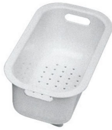
Passoire blanche 8151 100