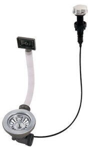
Vidange automatique 8407 100